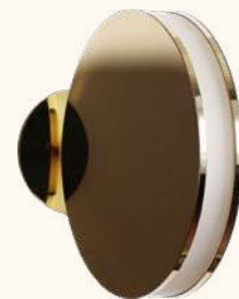
MYRA wall lamp