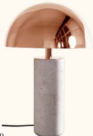
ADEI XL portable lamp