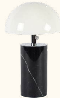
ADEI portable lamp IP44

Reference BAC02 Pictured finishes Red marble, chrome lamp shade Dimensions 23 x ø15 cm 9 x ø 5.9 in MOQ 2 PRICE PRO: EUR 260.60 PUBLIC: EUR 389.00