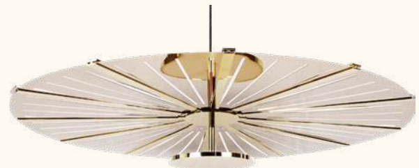
MADIA pendant lamp