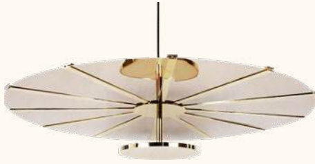
MADIA pendant lamp