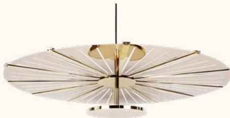
MADIA pendant lamp