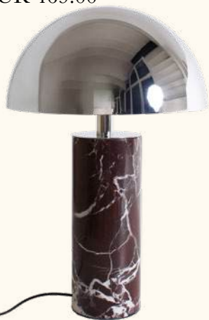
ADEI XL portable lamp