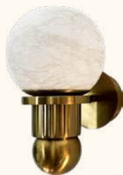
BILBO wall lamp IP44