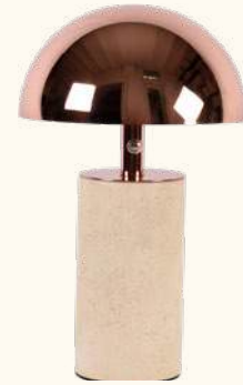
ADEI portable lamp IP44