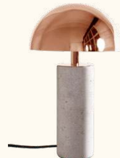
ADEI L table lamp