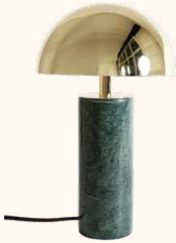
ADEI L portable lamp