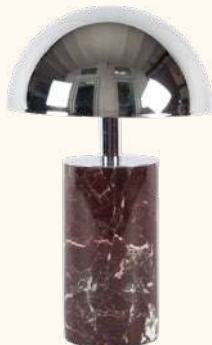
ADEI portable lamp IP44

Reference BAC02 Pictured finishes Red marble, chrome lamp shade Dimensions 23 x ø15 cm 9 x ø 5.9 in MOQ 2 PRICE PRO: EUR 260.60 PUBLIC: EUR 389.00