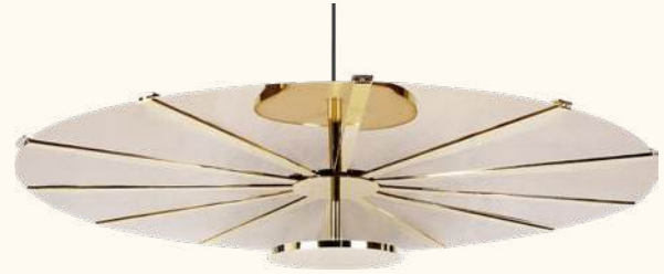
MADIA pendant lamp