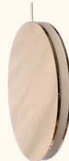
MYRA pendant lamp