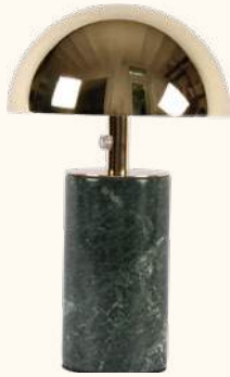
ADEI portable lamp IP44