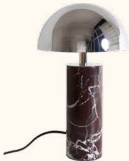
ADEI L table lamp