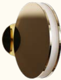
wall lamp/brass BAC04

The Myra wall light combines elegance and modernity with its unique design. Its mirror effect subtly reflects the surroundings, creating an illusion of depth, while a luminous edge emits a soft and enveloping light. Perfect for adding a touch of sophistication to any room, Myra transforms your walls into works of art.