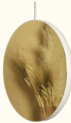
Pendant lamp/brass BAC05