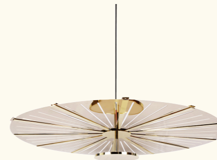
Pendant lamp/ suspension BAC27

MADIA is a pendant light that combines a precious yet minimalist character. Featuring a gold disc with a mirror-like surface, it captures and diffuses light with understated elegance. Hung from the ceiling, it draws the eye without overwhelming, playing with reflections and subtle shifts in illumination to create a warm and refined atmosphere. Every detail, from the polished metal to the delicate cutouts, contributes to its sculptural and timeless appeal.