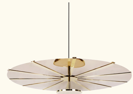
Pendant lamp/ suspension BAC25