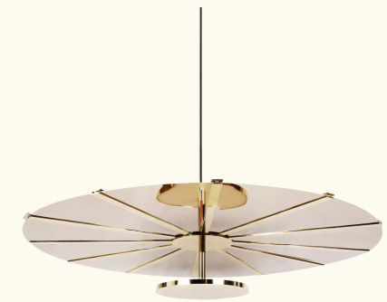
Pendant lamp/ suspension BAC24