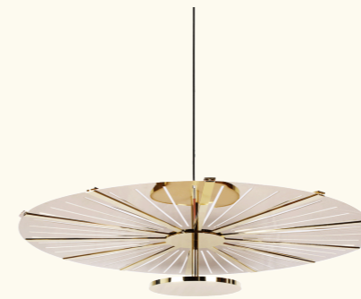
Pendant lamp/ suspension BAC26

MADIA is a pendant light that combines a precious yet minimalist character. Featuring a gold disc with a mirror-like surface, it captures and diffuses light with understated elegance. Hung from the ceiling, it draws the eye without overwhelming, playing with reflections and subtle shifts in illumination to create a warm and refined atmosphere. Every detail, from the polished metal to the delicate cutouts, contributes to its sculptural and timeless appeal.